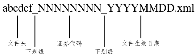
图 3：ETF 定义文件/确认文件/公告文件文件命名规范（xml 版）