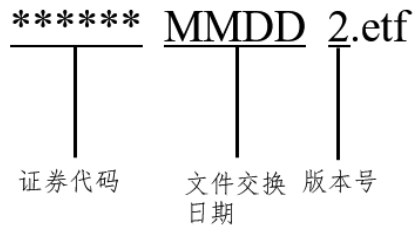
图 2：ETF 公告文件命名规范（2.1 版）